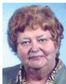
CALDO DORA in MANZAN