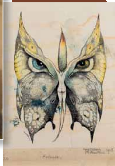
A. Martini, Felina, 1915.

e il quadro) e il mestiere (l'artista nell'atto di dipingere). È un quadro che rappresenta l'ideale artistico di Erler, l'idea dell'arte come mestiere e della pittura come strumento privilegiato per dare forma alla realtà.