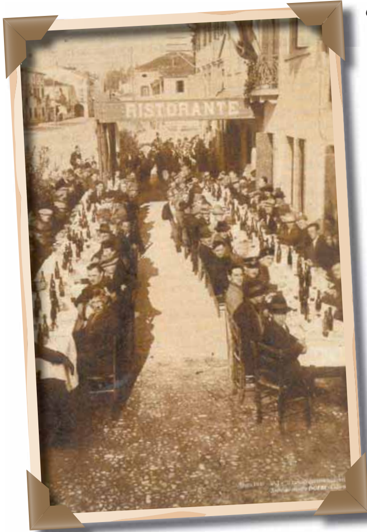
Oderzo 1937 Borgo Cavour ora via Garibaldi

Nel gennaio del 1936 gli Italiani conquistarono Neghelli. Si combatte duramente sul Tempin. Il 28 febbraio 1946 viene conquistato il massiccio dell'Amba Alagi. In aprile, dopo le vittoriose battaglie dello Scirè e del Lago Ascianghi, le nostre truppe sferrano una grande offensiva sull'Ogaden (15-25 aprile) al confine somalo etiopico. Il 2 maggio il Negus abbandona Addis Abeba e il giorno 5 gli italiani entrarono nella capitale nemica. La guerra è finita. Vittorio Emanuele 3° è proclamato "Imperatore d'Etiopia". La dittatura fascista è al culmine della sua popolarità ed è per questo motivo che in molti paesi d'Italia si festeggia l'avvenimento. Anche a Oderzo si festeggia con un grande "rancio" organizzato dai reduci della grande Guerra d'Etiopia, ma anche da altri fronti.