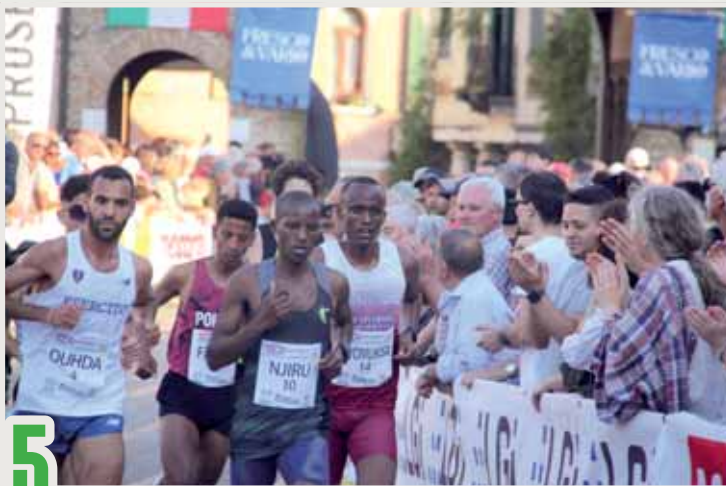
5 Gara maschile al passaggio sotto al Toresin