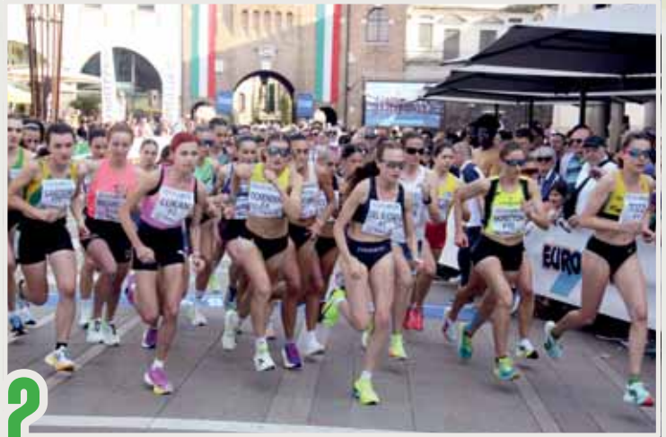
2 Partenza della gara femminile