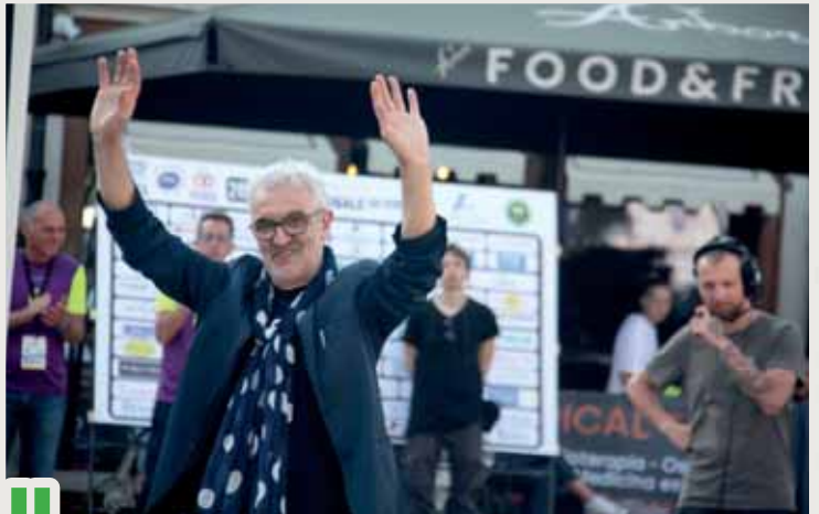
4 Gelindo Bordin, vincitore della maratona olimpica 1988, saluta il pubblico